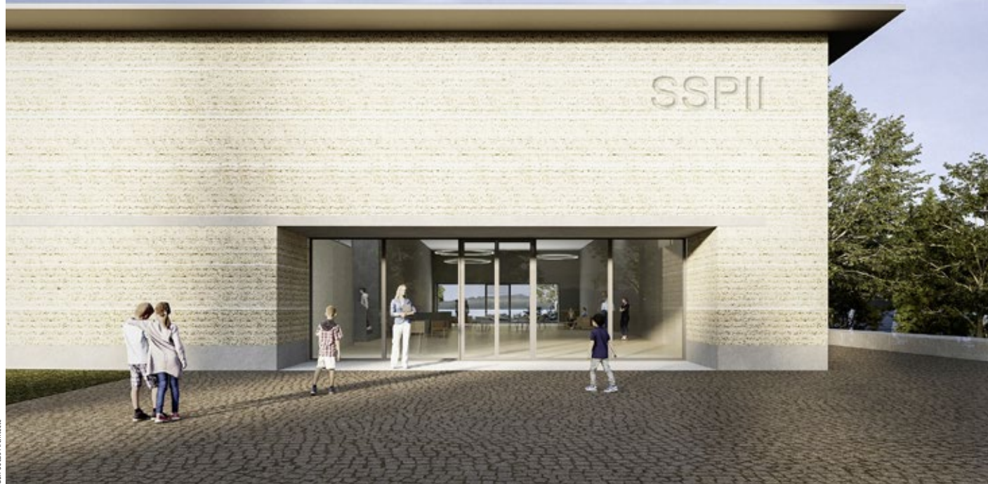
Juan Socas Architecte

Avec une capacité de production de plus de 100 000 m 3 par jour, l'usine Saint-Sulpice II assurera entre 30 et 50 % de la demande en eau potable de la région lausannoise, qui compte environ 380 000 habitants. Le débit d'eau traitée passera de 1 m 3 /s actuellement à 1,4 m 3 /s. Un gain de 40 %!